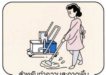
สำหรับทำความสะอาดพื้น