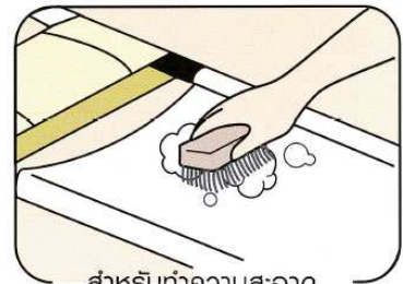
สำหรับทำความสะอาด ผ้าใบของเปลหาม