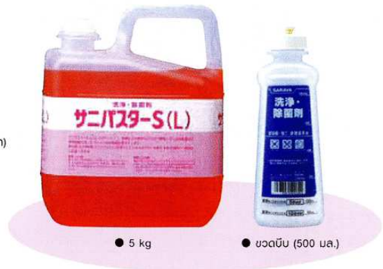
● 5 kg