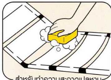
สำหรับทำความสะอาดเปลหาม