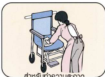
สำหรับทำความสะอาด เก้าอี้ล้อเลื่อน