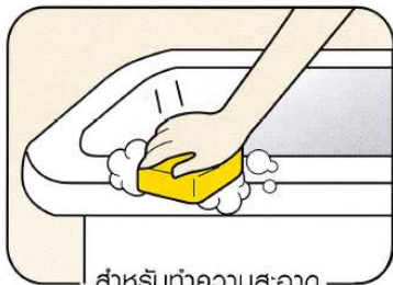
สำหรับทำความสะอาด อ่างอาบน้ำที่เคลื่อนย้ายได้