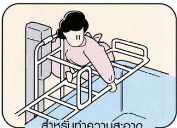
สำหรับทำความสะอาด เปลหาม ลิฟต์ เติียง เป็นต้น